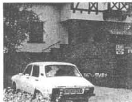
...In het Moezeldal...

Als voornaamste kenmerk van deze lange-duur test kwam naar voren dat de Dacia een zeer betrouwbare