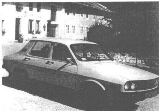
...Op de terugreis, de Dacia houdt zich nog steeds uitstekend...

De Dacia 1210 Standaard heeft de 25.000 kilometer-test met glans doorstaan. Dacia brengt voor als opmerkelijk laag bedrag, namelijk slechts 11.995 gulden, een sterke, zeer betrouwbare gezinswagen op de markt waarop men helemaal kan vertrouwen.