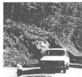
...In de bergen van West-Zwitserland...

Het zou eenvoudig geweest zijn om elke dag op een autosnelweg lange trajecten af te leggen. Maar dat zou tevens een onjuist beeld hebben gegeven van het praktijkgebruik. Want alleen onder normale omstandigheden kun je pas goed nagaan wat de eigenaar van de Dacia 1210 Standaard mag verwachten.