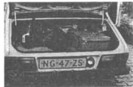
...De ruime kofferbak en het gerieflijke interieur maken de Dacia tot een gezinswagen bij uitstek...

moedigheid tijdens of na lange ritten geen sprake. De bagageruimte, met een inhoud van 420 liter neemt voor langere vakanties alles mee. Prettig zijn ook de vier deuren, die makkelijk toegang verschaffen tot het ruime interieur.