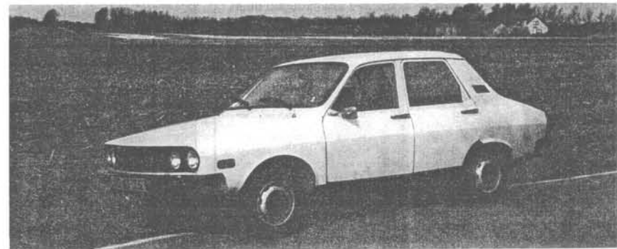
...De Dacia 1210 Standaard in het Nederlandse platteland...

(Tussentijdse prijswijzigingen voorbehouden).