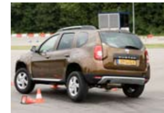
De Duster 4x4 tilt hooguit een achterwiel op, maar blijft verder goed aan de grond.

We melden onze ervaringen met het bochtgedrag van de Duster bij importeur Renault Nederland. Die speelt het meteen door aan het hoofdkwartier in Parijs. En twee dagen later al komen twee technische experts van Renault/Dacia naar Nederland om met eigen ogen te zien wat er fout gaat met de Dacia Duster. Op het test- en trainingscentrum van de ANWB in Lelystad voeren we onder toezicht van Renault onze uitwijkmanoeuvre nogmaals uit.