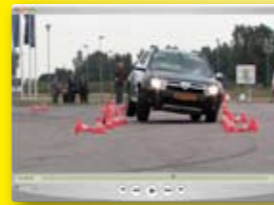
Video-opnamen van onze uitwijkproef met de Dacia Duster zijn te zien op anwb.nl/auto .