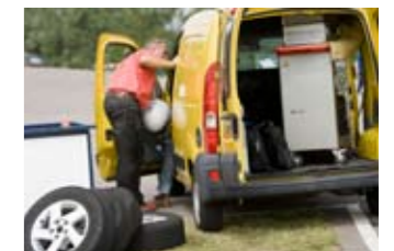
Renault had eigen meetapparatuur meegenomen uit Frankrijk om onze testresultaten te vergelijken met de hunne.