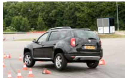
Bij de voorwielaangedreven Duster komen de twee binnenste wielen los van de grond. ESP zou dergelijk gedrag kunnen voorkomen maar is – nog – niet leverbaar.